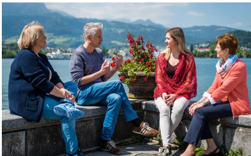
Le persone affette da malattie croniche o protratte nel tempo traggono particolare beneficio dai gruppi di auto-aiuto.

zione e rifiutare. Ma sappiamo per esperienza quanto sia importante avere queste informazioni a portata di